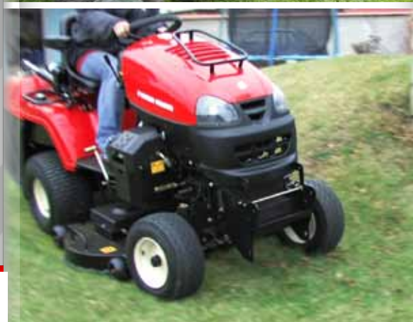
posilovač řízení pomáhá v náročném terénu