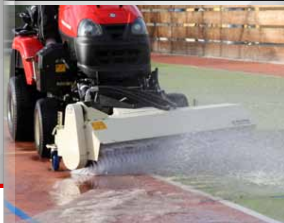
univerzální zametací kartáč