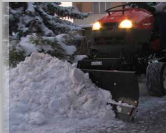
profi radlice 140 cm na předním závěsu